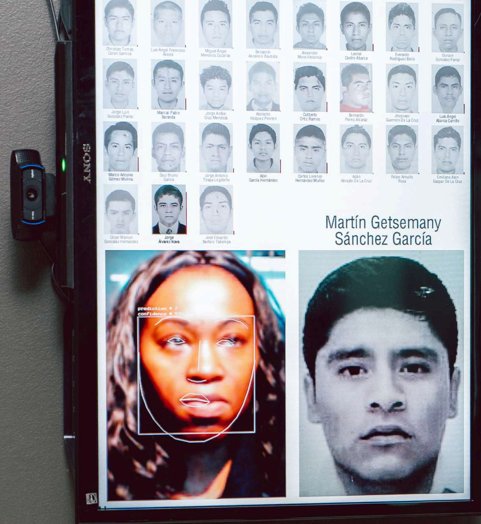
Montréal I.A. // Soirée de lancement du Printemps numérique Série des "5 à 9 au McCord" - 2018

Cette vision ambitieuse est toutefois réaliste. Elle ne se contente pas de décrire ce que le Printemps numérique fera, mais esquisse la transformation souhaitée de l'écosystème et de la société grâce à son action concertée.